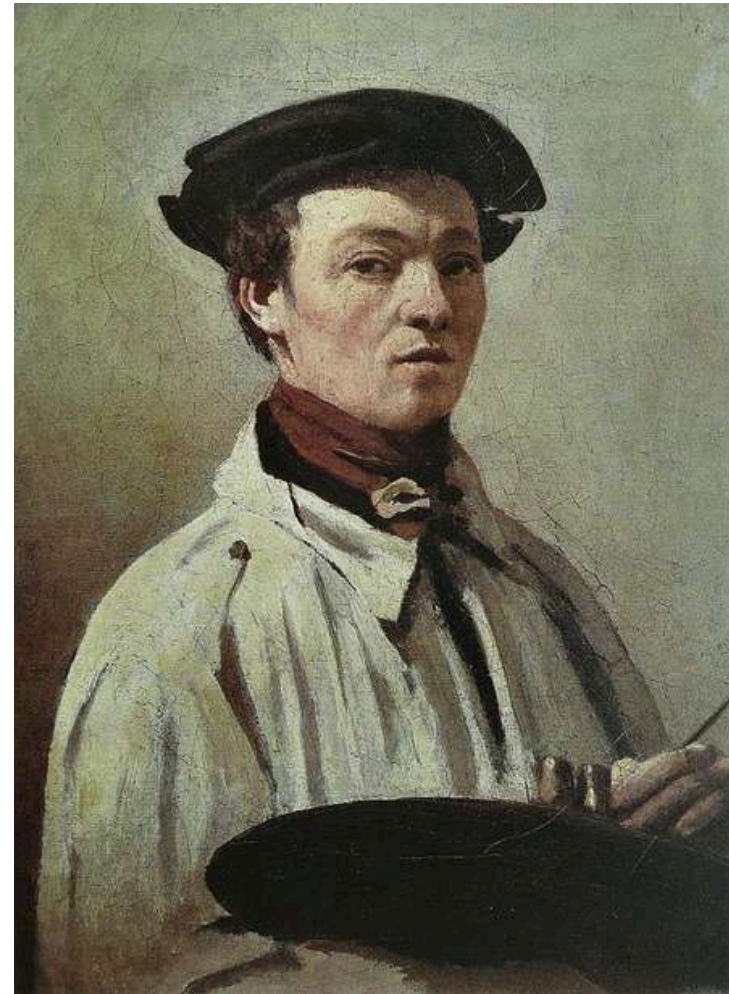
Corot - Autoportrait

Côtes de Provence 2023 Domaine de l'Odysée 11 €