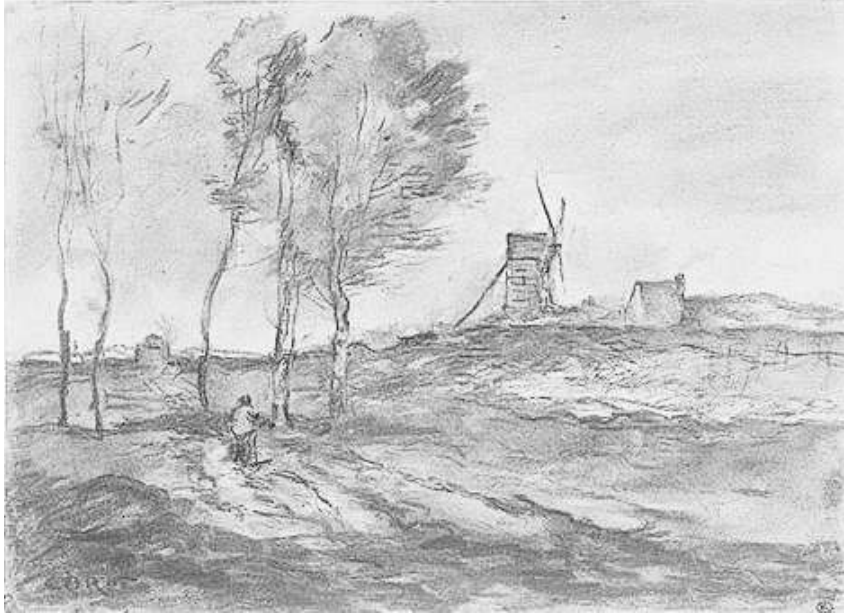
Corot - Moulin dans les Dunes