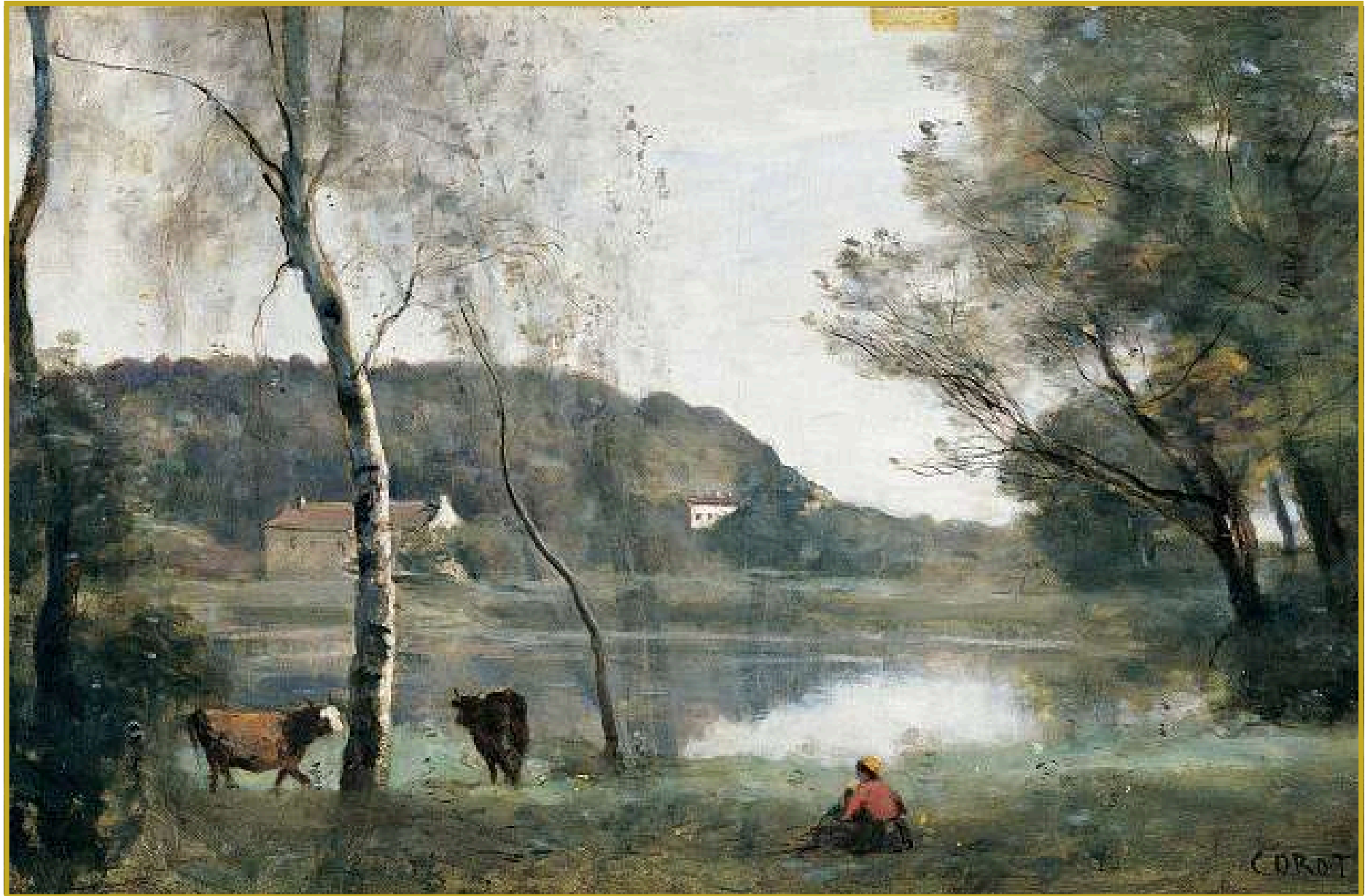
Corot - Deux vaches près d'un bouleau en vue de l'étang