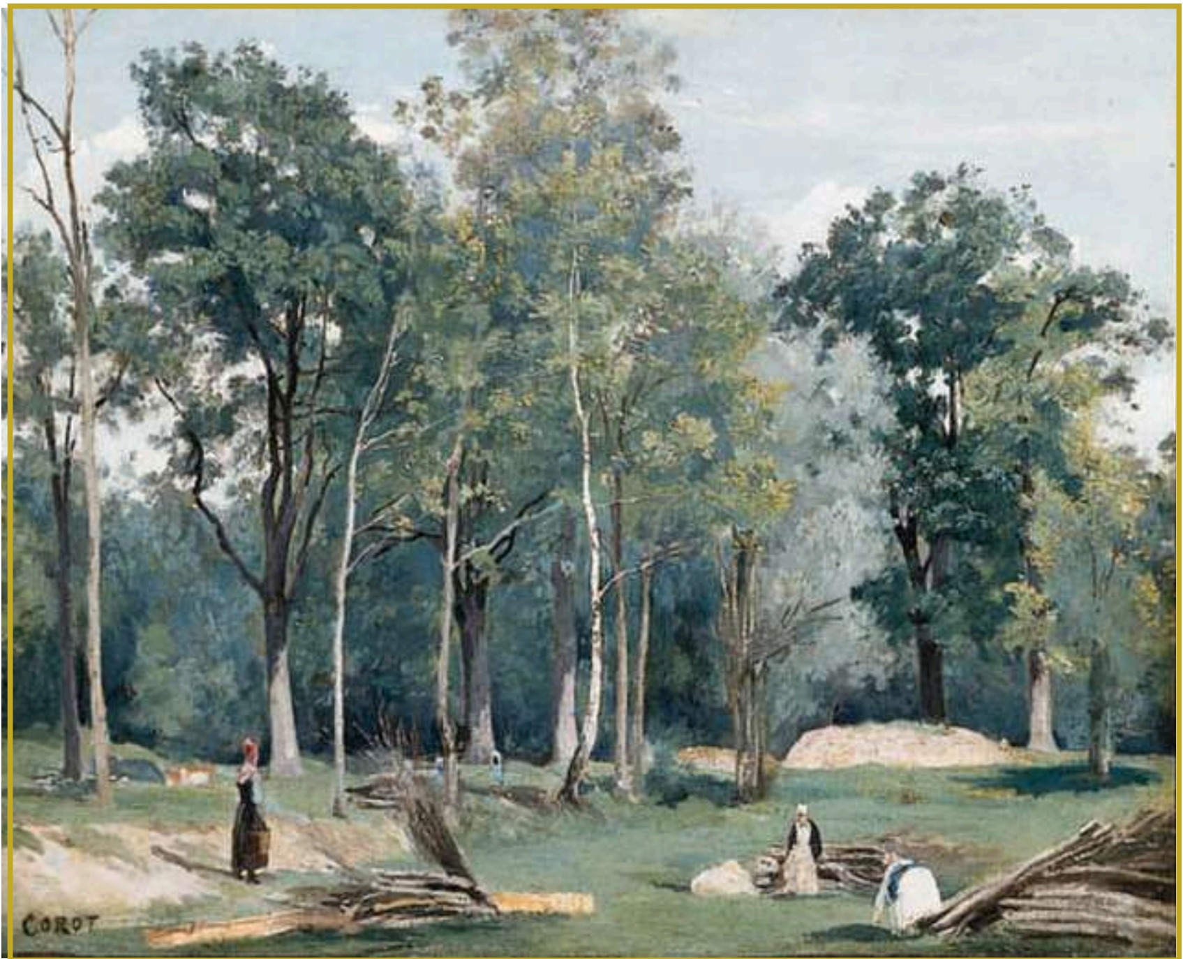
Corot - Bûcheronnes dans une Prairie au Bord des Bois