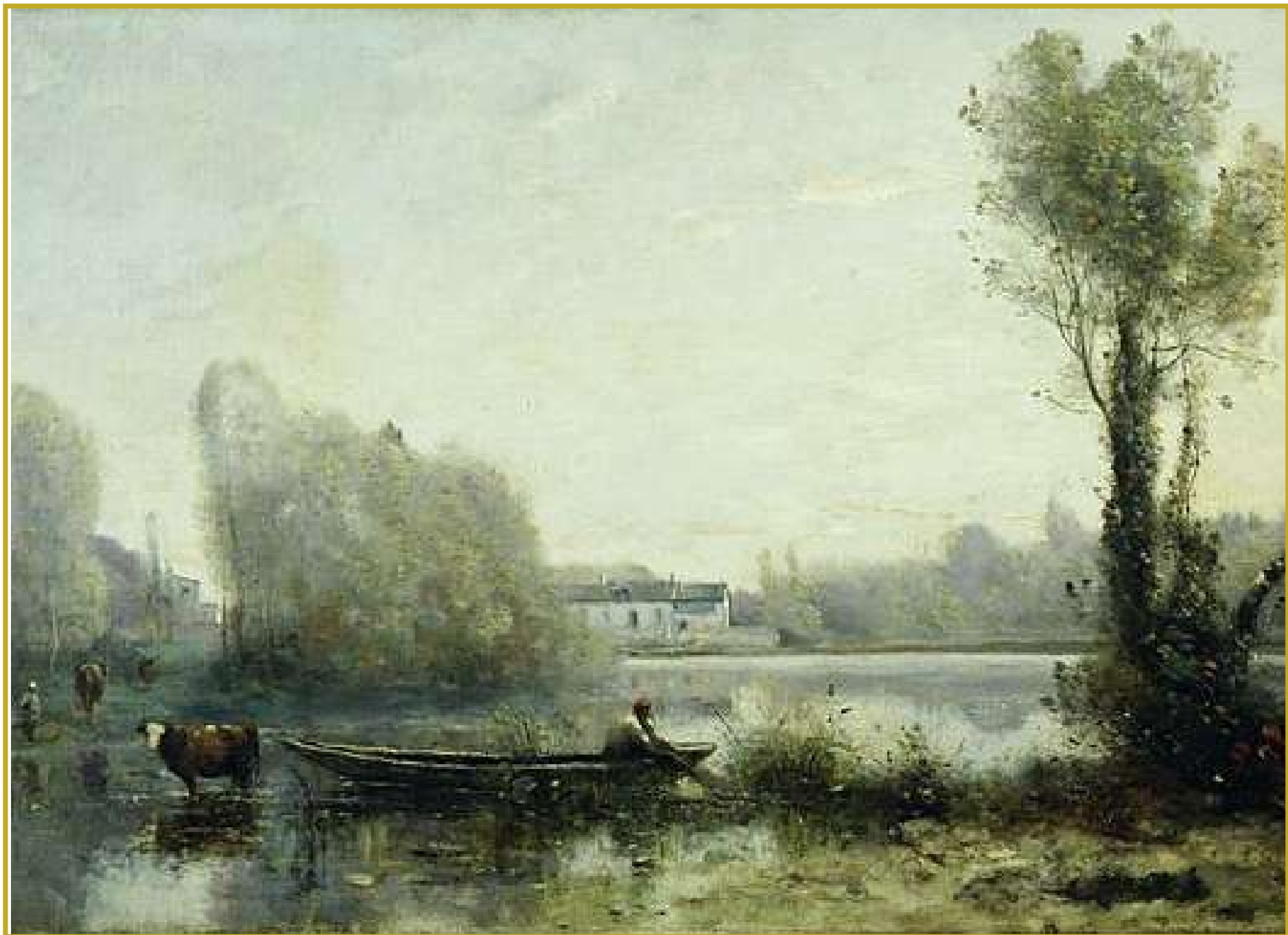
Corot - Batelier et vache dans l'étang.