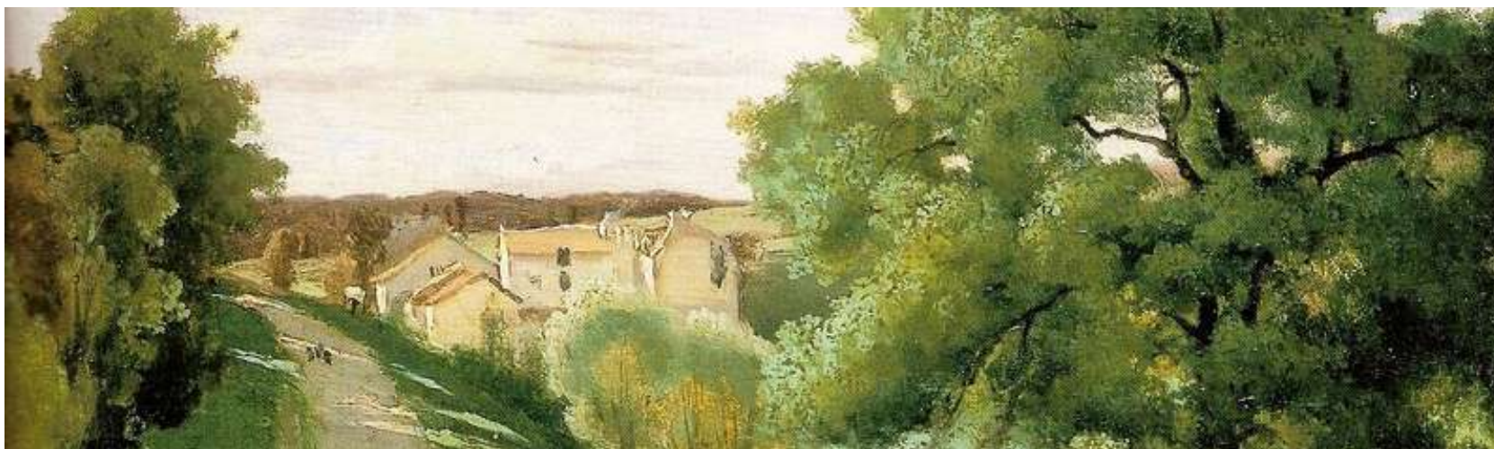
Corot - Le petit Chaville