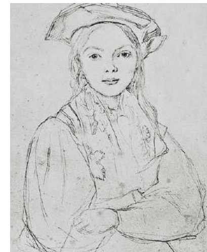
Corot - Portrait d'une jeune fille coiffée d'un béret.